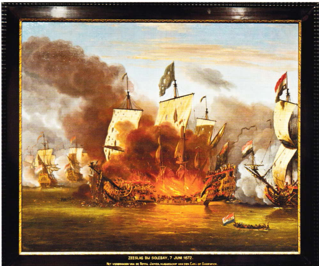
De aanval op de Royal James. Slag bij Solebay. Willem van de Velde jr.