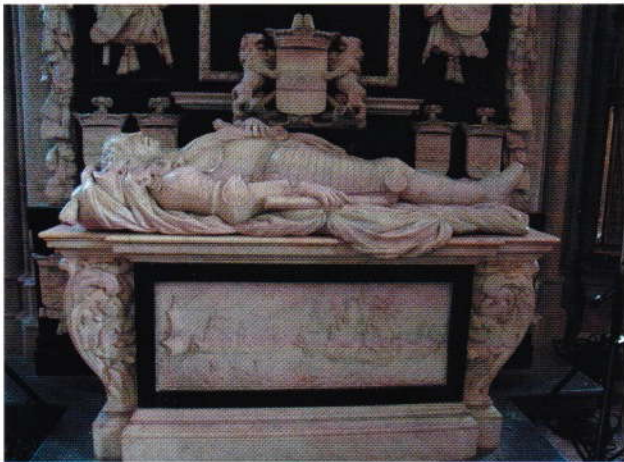
Praalgraf in de Domkerk van Utrecht.

En onze Johan als enige overlevende broer? Hij bleef druk buitenshuis. Misschien dat hij zich verveelde in het kleine landelijke Winssen? In 1679 liet hij wel een gloednieuwe klok in de kerktoren hangen, die er anno 2022 nog hangt. Johan overleed in 1702.