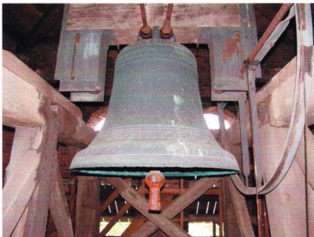
De klok in de oude kerktoren van Winssen.

En onze Johan als enige overlevende broer? Hij bleef druk buitenshuis. Misschien dat hij zich verveelde in het kleine landelijke Winssen? In 1679 liet hij wel een gloednieuwe klok in de kerktoren hangen, die er anno 2022 nog hangt. Johan overleed in 1702.