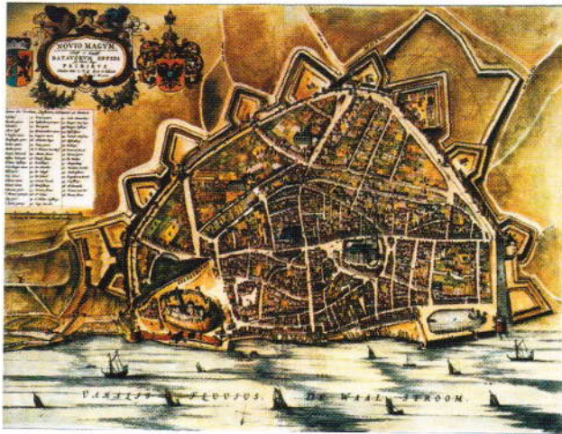
Plattegrond van Nijmegen 1652. F.J. Blaeu, (Bron: Wikimedia Commons).

De Fransen passeerden op 12 juni (nieuwe kalender) Lobbith en trokken met een enorme overmacht in de richting van Fort Knodsenburg aan de noordkant van de Waal. Dit fort werd door kapitein Verschoor met ruim 300 manschappen verdedigd. Knodsenburg viel op 16 juni. De kanonnen werden naar de stad gedraaid en de beschieting van Nijmegen begon. Op hooggelegen plekken in de stad werden brandwachten ingesteld om snel te weten te komen waar in de stad branden ontstonden. Niettemin liep bijvoorbeeld de Stevenskerk flinke schade op. Bij herhaling werden Franse officieren naar de Magistraat van de stad gestuurd om te vertellen dat als de stad zich niet overgaf, de koning zwaar ontstemd zou raken en de voorwaarden voor een wapenstilstand strenger zouden zijn. Het stadsbestuur hield vol de plicht te hebben de stad te verdedigen. 4